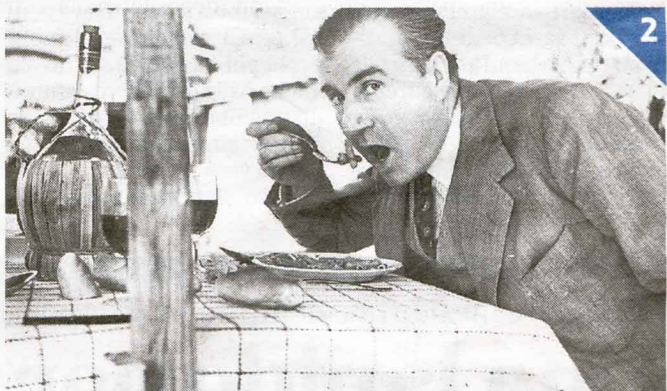
Il tenore a tavola: era una buona forchetta